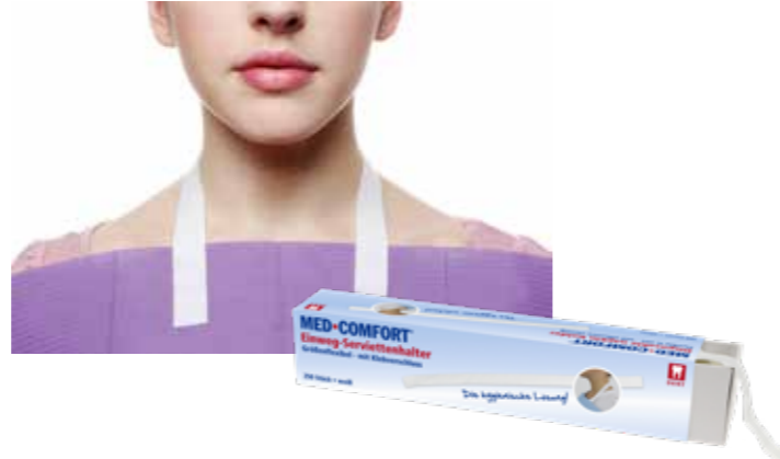
09027-Halter Med-Comfort Patientenserviettenhalter Holder for disposable napkins