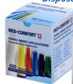
4 x 100 Box