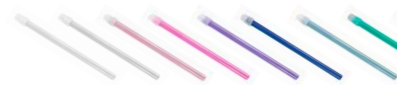
09010 Speichelsauger 130 mm mit abnehmbarem Filter Saliva ejectors 130 mm with removable filter