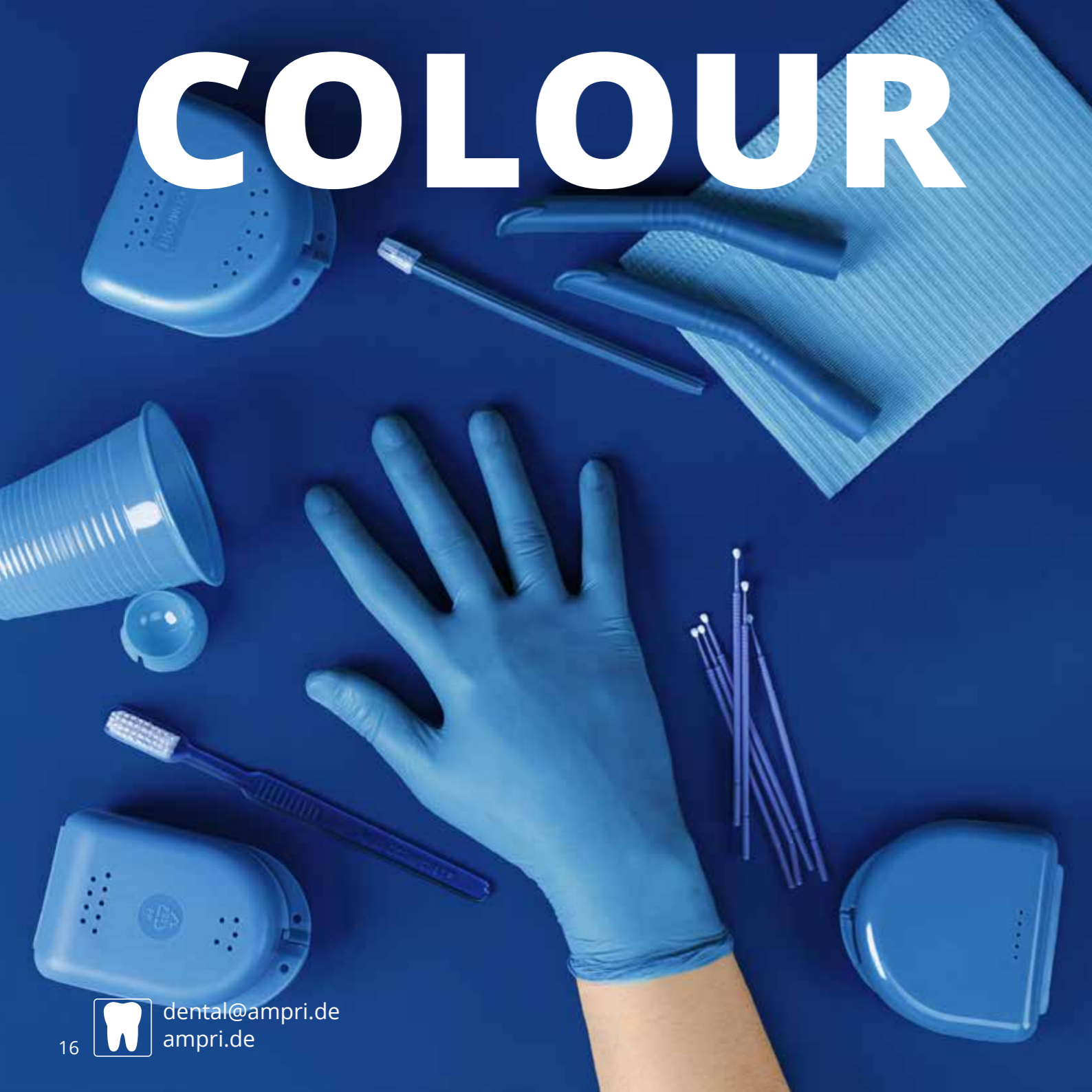
09030 Mundspülbecher aus Kunststoff 180 ml, Karton 3.000 Stk. Plastic cups 180 ml, carton 3,000 pcs