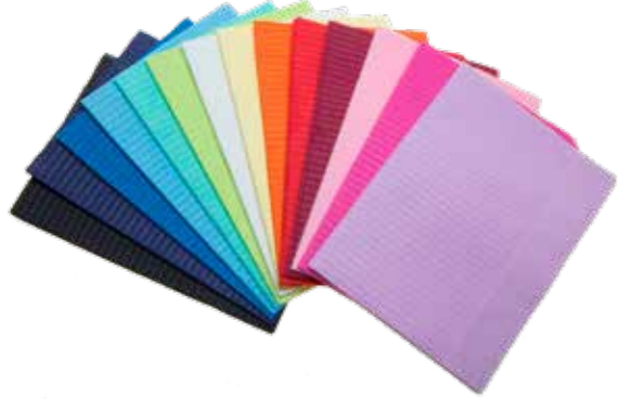
09027 + Farbe Patientenservietten Disposable napkins