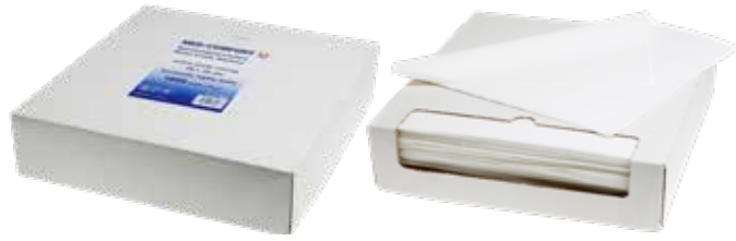
09020 Med-Comfort Nasskreppservietten Med-Comfort moist crepe napkins