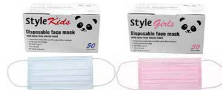
02400-KIDS/GIRLS Style Mundschutz/ Facemask