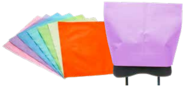
04906 Kopfstützenschoner Headrest cover