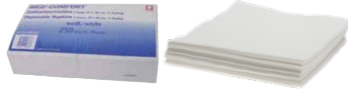
09025-W-2 Med-Comfort Zellstoffservietten Med-Comfort cellulose napkins