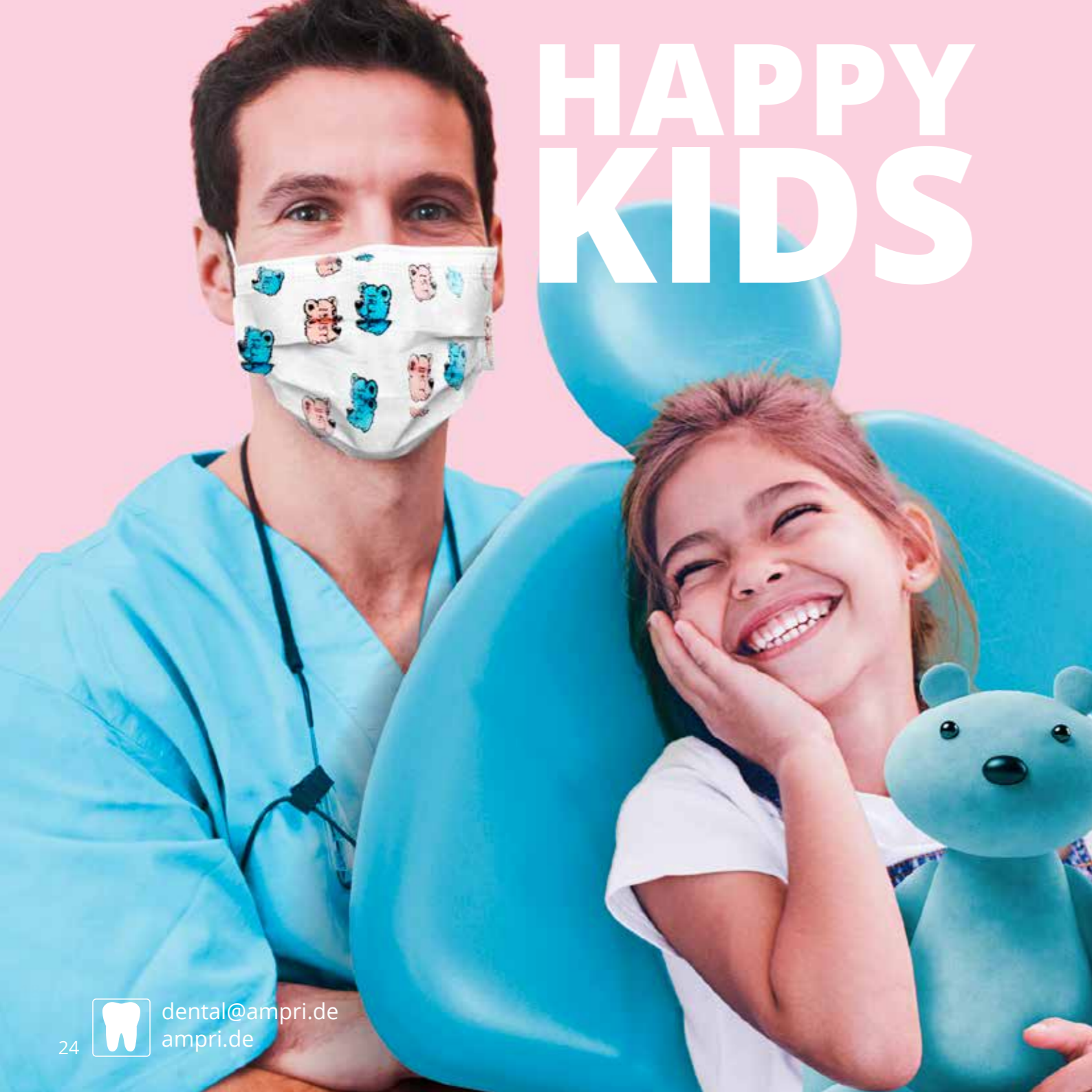
02501 Happy Kids Mundschutz/ Happy Kids facemask