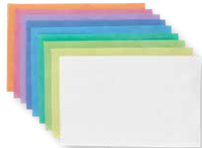
09041 Tray-Filterpapier 28 x 36 cm/ Tray-filter paper 28 x 36 cm