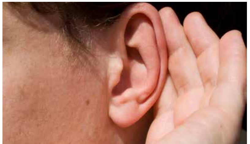
Wir wissen: Nur so können wir unsere Produktpalette an die Kundenanforderungen anpassen und innovative Produktentwicklungen in der Herstellung erfolgreich umsetzen.

Neue Produktionsverfahren, die es ermöglichen, Artikel nachhaltiger zu produzieren und damit die Umwelt zu schonen, stehen auf der Prioritätenliste weit oben. Mit Hilfe unserer Erfahrung und dem Innovationsgeist aller unserer Mitarbeiter setzen wir alles daran, dabei das optimale Ergebnis für unsere Kunden zu erzielen. Außergewöhnliche Anforderungen sind für uns immer eine Herausforderung. Ständig versuchen wir, unsere Wege zu optimieren, und haben deshalb immer ein offenes Ohr für Anregungen und Kundenwünsche.