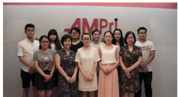
Mitarbeiter im Kooperationsbüro in Ningbo/China. Hier wird die Qualität vor Ort gesichert.

AMPri kooperiert mit einem Büro in China, welches für die Qualitätskontrolle, Produktüberwachung und die Auswahl versierter Produktionsstätten vor Ort zuständig ist. Das Büro ist ein essenzieller Bestandteil unseres Netzwerks. Weiterhin arbeiten wir eng mit einem Partner mit Produktionsstätte in Bosnien zusammen, in der diverse medizinische Artikel gefertigt werden. Unser Qualitätsmanagement hier und die QM in den Fertigungsländern sorgen dafür, dass alle gängigen und gesetzlichen Anforderungen eingehalten werden. Die Nähe zu unseren Produktionsstätten in China, Thailand, Malaysia, Indonesien, Vietnam und Sri Lanka sowie in diversen europäischen Ländern garantiert eine große Produktvielfalt, die auf nahezu jede Kundenanforderung abgestimmt werden kann.