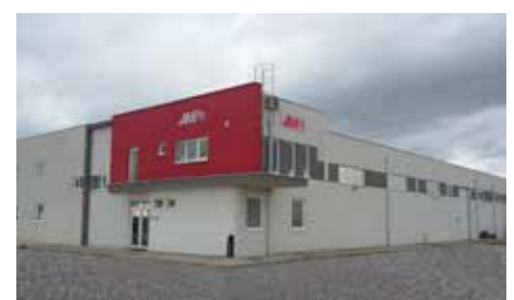
Partner Fertigung/Lager/Büro Bosnien