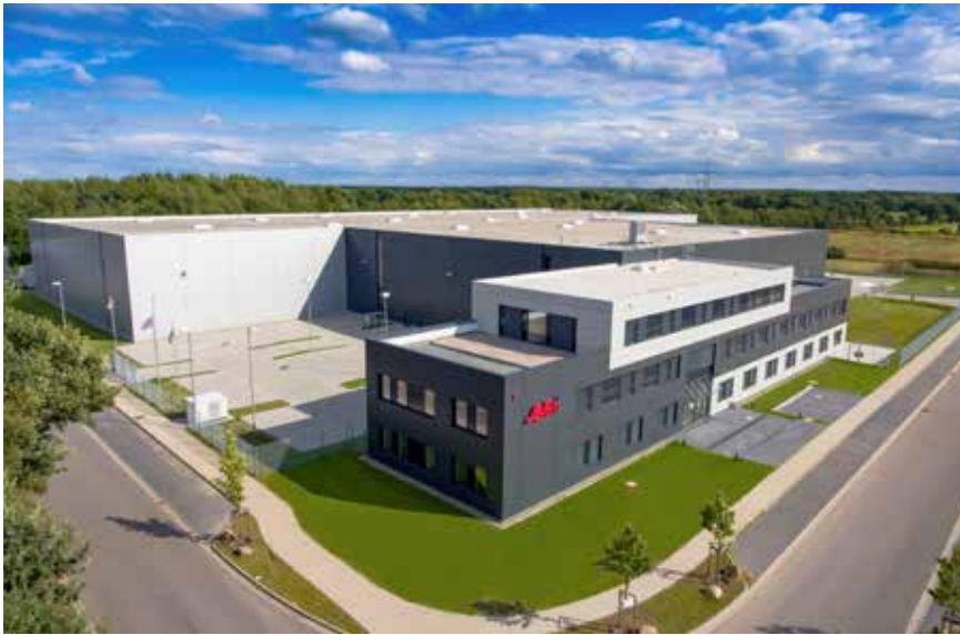
AMPri am neuen Standort in Winsen/Luhe bei Hamburg – der Fokus liegt auf Wachstum. Die Lagerkapazität umfasst jetzt gut 15.000 m 2 . Viele Artikel sind dadurch dauerhaft und somit noch schneller verfügbar. Kundenaufträge können unmittelbar und termingerecht bedient werden.