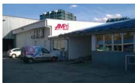
Partner Lager/Büro Serbien