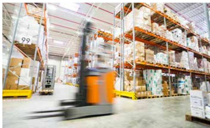
AMPri Lager - Fokus Wachstum.