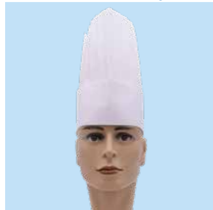
03030 Kochmütze/Chef hat Viskose, German Style