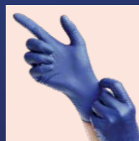
01166 Epiderm Protect